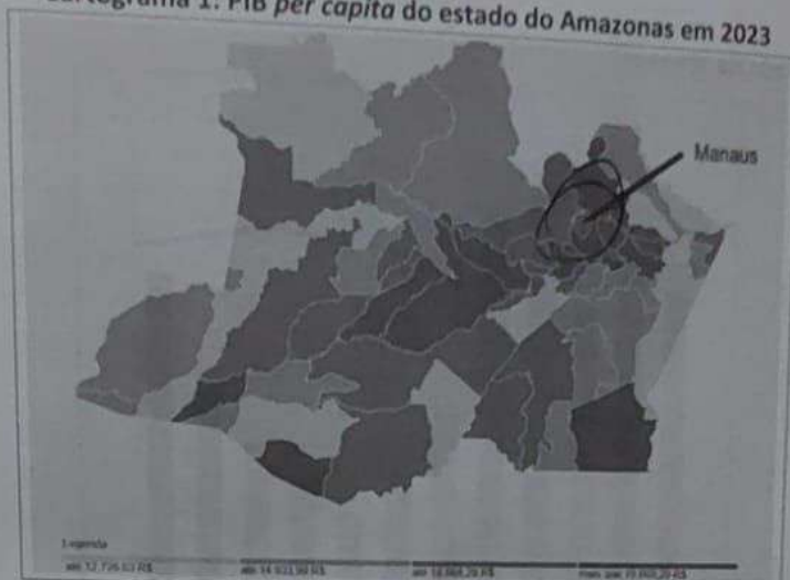
Cartograma 1: PIB per capita do estado do Amazonas em 2023

(Disponível em: https://cidades.ibge.gov.br/brasil/am/manaus/panorama . Acesso em: abril de 2025.)